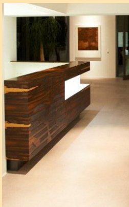
Empfangstheke mit Zircote bei Schorn & Groh