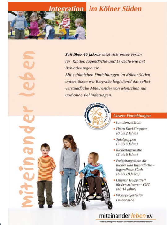
DIN A0 Plakat-Serie

Webseite mit Content-Management-System: www.miteinander-leben.com