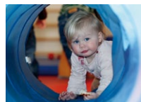
Spiel mal mit!