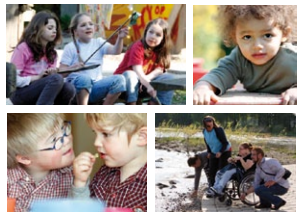
Integration im Kölner Süden www.miteinander-leben.com