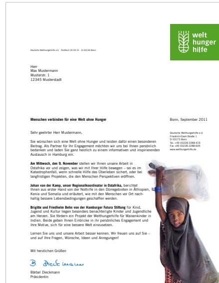
Einladungs-Mailing, DIN Lang, 6-seitig und Anschreiben.