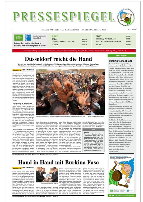
8-seitiger Pressespiegel im Zeitungsformat zur Dokumentation der Städtepartnerschaft Düsseldorf – Deutsche Welthungerhilfe e.V.