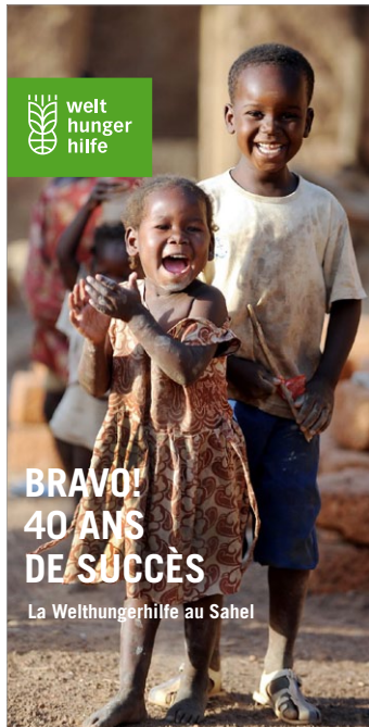
24-seitiger DIN-lang-Flyer / 40 Jahre Sahel